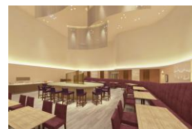
カフェ(ロビーフロア)

5階ロビーフロアにてカフェ(日本ホテル株直営)がオープン。朝早くから活動を始めビジネス・レジャー利用のお客さまにもしっかりと朝食をとっていただけます。カフェタイムは、お勤めの方々のミーティングや地域の方々の憩いの場としてご利用いただけます。