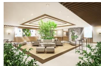
ブライダルロビーイメージ