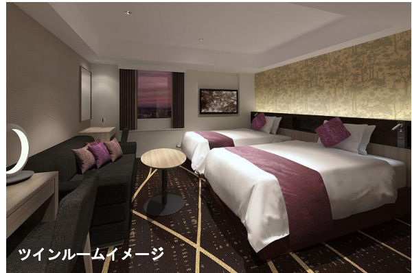
ツインルームイメージ