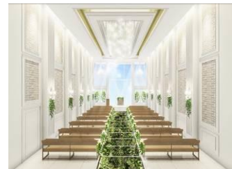
チャペルイメージ