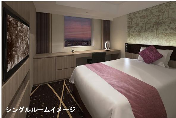
シングルルームイメージ