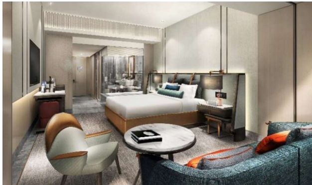
イメージパース(スタンダードルーム)

タワー棟の上層階に位置する「メズム東京」は、JR 東日本グループである日本ホテル(株)とマリオット・インターナショナルが初提携したラグジュアリーホテルです。グローバルレベルのサービスでお客様の五感を魅了し、世界中からのお客様をお迎えします。このたび、2020年4月27日(月)の開業決定を記念して、ダイニングクレジット付き開業記念宿泊プランを販売します。