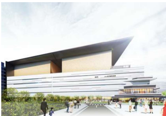
(イメージパース)シアター棟外観