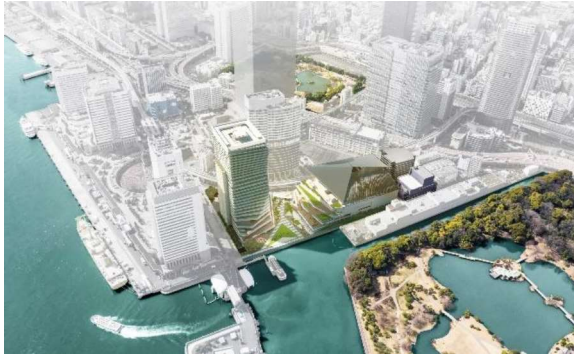
イメージパース(浜離宮恩賜庭園側外観)