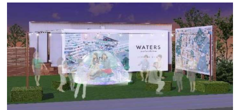
イベントイメージ

開催予定日 2019年9月12日(木)～9月15日(日) 開催時間 15時～23時 場所 The Farm Tokyo 内イベントスペース (東京都中央区八重洲2丁目1-1)