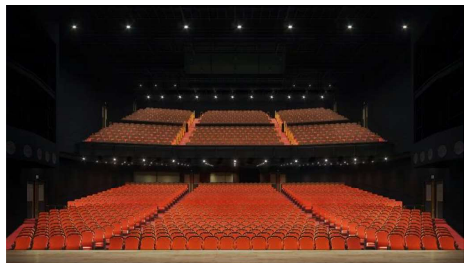
(イメージパース)JR 東日本四季劇場[春] 客席