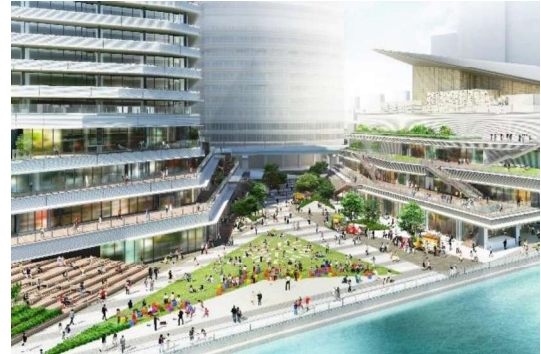
イメージパース(広場・テラス・水辺)