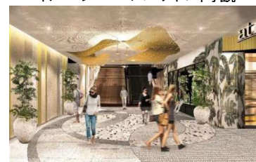
イメージパース アトレ内観