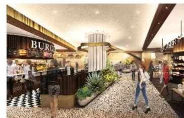
イメージパース アトレ内観

アート・ファッション・カルチャーに焦点をあてたラグジュアリーナイトクラブラウンジや五感を研ぎ澄ませ、自らの感性を高めることができる日本初のソーシャルエンターテインメント施設、水辺を臨む開放的なテラスで食事を楽しめる飲食店などが入居を予定しています。