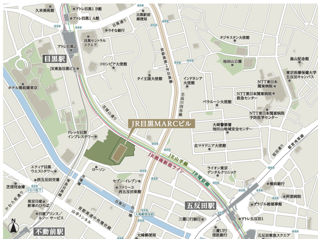
JR 目黒 MARC ビル 位置図