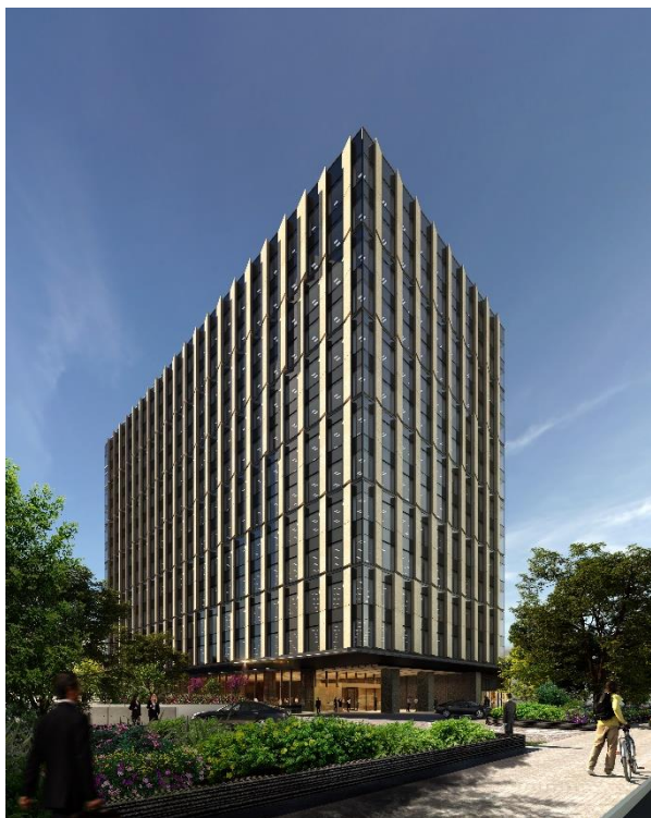
JR 目黒 MARC ビル 外観

JR 目黒 MARC ビルは、2016年8月に竣工した当社初の自社単独開発物件「JEBL 秋葉原スクエア（ジェイビルアキハバラスクエア）」に続く物件として、都心にありながらも豊かな緑に囲まれた広場のある場所で2022年3月の竣工をめざします。