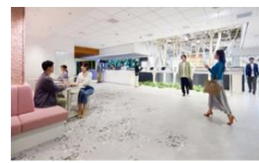
▲ ワークスタイル 東京ミッドタウン八重洲