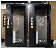
▲ STATION BOOTH